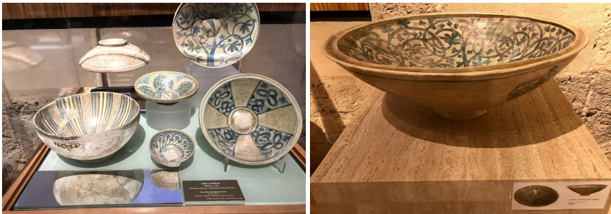
Fig. 1 y 2. Ataifores del periodo nazarí del siglo XIV. Museo de la Alhambra de Granada. 10

servir viandas ( DRAE ). En este contexto se refiere a un cuenco pequeño de uso doméstico. En sus orígenes, designaba una bandeja de azófar o latón que después pasó a indicar cualquier tipo de plato. En sus estudios arqueológicos, Roselló lo describe como parte del ajuar doméstico andalusí para el servicio de mesa, ya que era una pieza habitual de las vajillas hispanomusulmanas. Lo clasifica como un plato de servicio con gran variedad de acabados, que puede presentarse sin vidriar (ejemplares arcaicos) o vidriado (melaos, verdes, etc.). Es una pieza rastreable en todas las épocas del Al-Andalus (1991: 167). Por su fuerte difusión, sobre todo en el último periodo del islam-andalusí (siglos XIV y XV), y ya que se extendió fuera del Al-Ándalus y propició imitaciones, resulta difícil de clasificar y diferenciar de otros recipientes como vasos, escudillas, platos y fuentes de la producción islámica peninsular. Así mismo, apunta este historiador, se desconocen los centros productores entre los que se barajan Almería, Málaga y Granada [1987: 289].